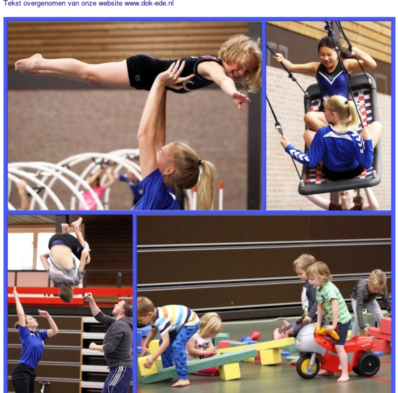
Meer foto's van deze activiteit staan op onze website www.dok-ede.nl

Tekst overgenomen van onze website www.dok-ede.nl